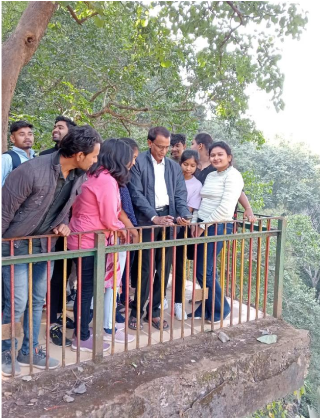
Use of GPS at Kapil Dhara Water fall Amarkantak