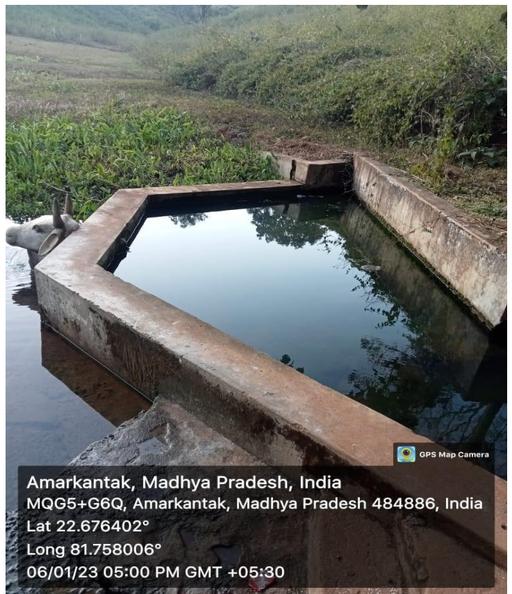
Head Water source of Arpa River, Tawadabra, Gourella.