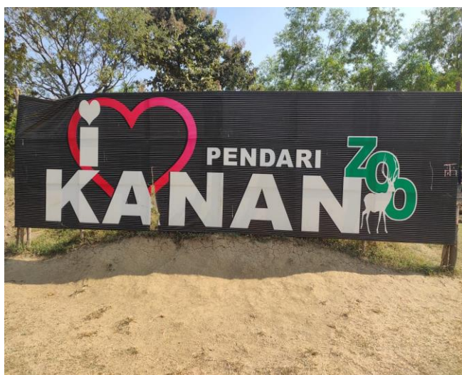
Kanan Pendari Zoological Garden of Bilaspur