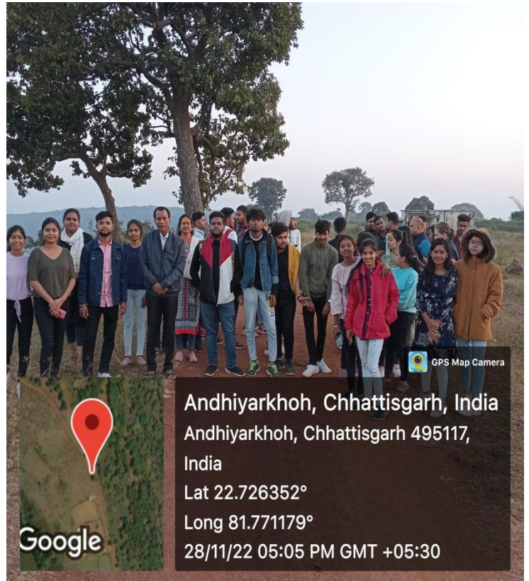
Faculty & Student at Rajmergarh Hill