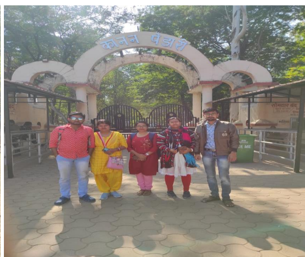
Excursion group of C. M. Dubey P.G. College, Bilaspur