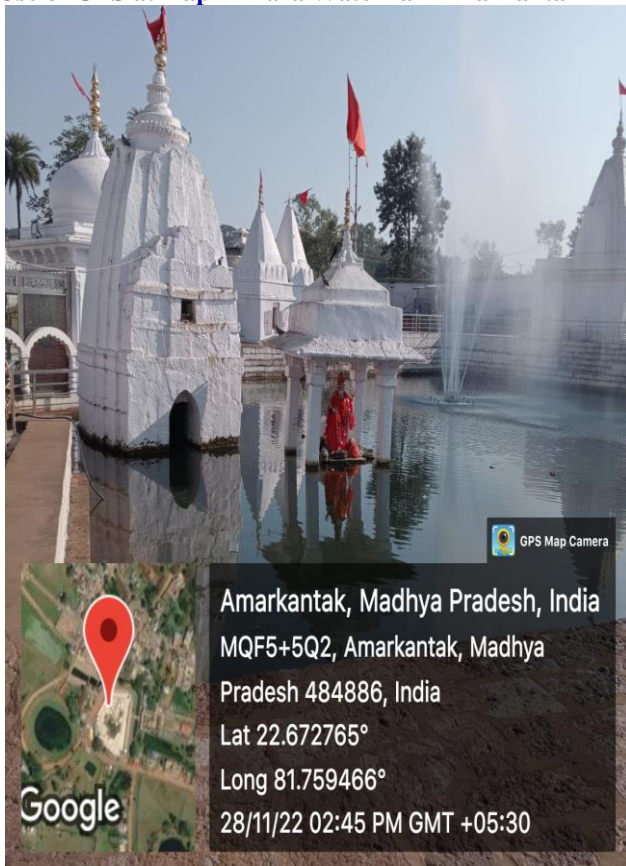
Water source of Narmada River, Amarkantak